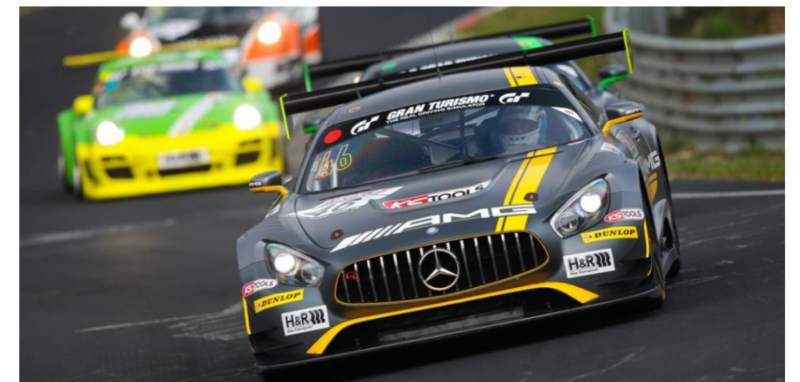
Ausnahmeregelung: 2 Aufkleber (in Absprache mit SPORTTOTAL)